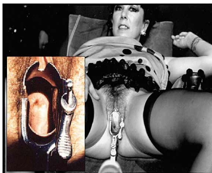
Public cervix announcement, de Annie Sprinkle.

Expondo publicamente o colo de seu útero, ela esperava dar ao “caro explorador online ” a oportunidade de ver o que poucos viram antes. E como a curiosidade é enorme, há tantos países a percorrer e o tempo é curto, recorreu à tecnologia, que possibilita a visitação online de “milhares de pessoas” ao seu interior: “Você não tem que ficar na fila, você pode simplesmente visitar o caminho para o meu colo uterino”. 7 Apesar de ter a vagina escancarada à visitação pública, a artista afirma que desmistificar o corpo feminino é uma impossibilidade, visto que ele engendra um grande mistério, não importa quantos você veja: “É um milagre magnífico — a porta de entrada para a própria vida”.